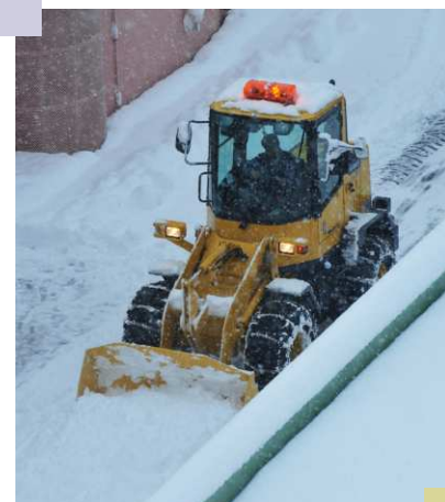
丁寧さと迅速さが望まれる 除雪作業

答弁 9月までに今年度の除排雪計画案をまとめ、16地区の説明会において意見交換を予定している。