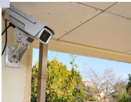
生徒のプライバシー保護と 安全確保の両面から必要性が 議論されている防犯カメラ (イメージ写真)