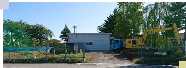
江釣子学童保育所 2ヶ所のうち1ヶ所の移転建替 工事がやっと始まった。 奥のプレハブが残す1ヶ所で 隣接地に2階建ての予定。

尚、今回の改正の対象は、 江釣子小、黒沢尻東小、黒沢尻西小、黒沢尻北小、飯豊小の学童保育所のみが対象 です。他の学童保育所については、建替えや施設の買取なども含めて、順次対応していくとの事でしたが、具体的な今後の年度計画までは未定でした。