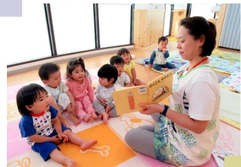
無償化の目的は子ども達の為では？ (イメージ写真)

また、市立保育園では専任事務員が常駐しておらず、2名が各園を巡回して事務処理を行っていますが、副食費の徴収事務が増える事から、1名増員するとの事です。