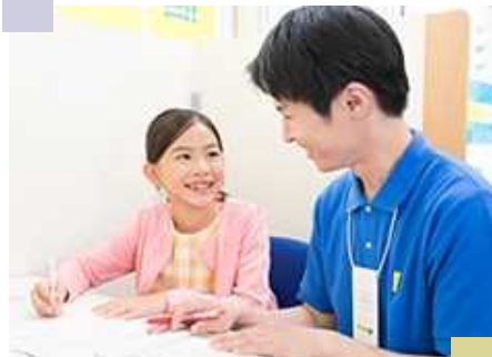
親の所得格差が学習機会の差とならないような制度を (イメージ写真)

成人式の来賓挨拶は、国会議員や県議会議員より、地域の方(例えば自治協会長など)から挨拶を頂き、より郷土への愛着を醸成できようにはどうか、という質疑に対して、議員にはいろいろな話をしてもらうように依頼している、誰の為の式典なのかを踏まえて検討する、との答弁。