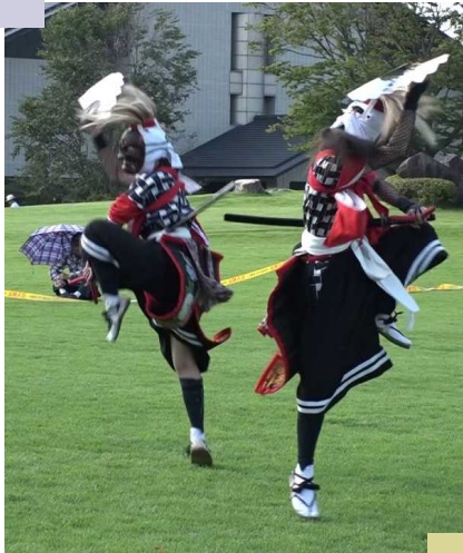
市の代表的な民族芸能 鬼剣舞 (イメージ写真)

今回は、(*)債務負担行為ですので、実際の支出にはその年度毎に予算計上する必要がある為、 とりあえず可決した形 です。