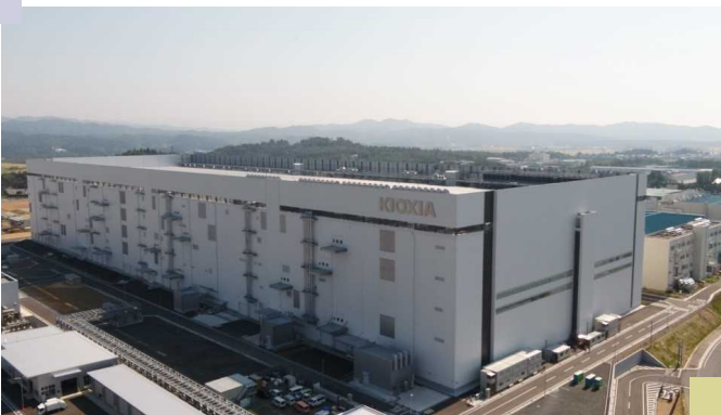
令和元年10月に竣工した キオクシア岩手(株)第1製造棟

(*)債務負担行為は、支出が見込まれる債務の負担を設定する行為であり、その時点で確定するものではありません。したがって、実際に支出が必要となった場合は、あらかじめ歳出予算に計上(現年度化)しなければなりません。