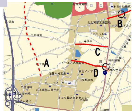
南部工業団地アクセス道路の ②の質問箇所