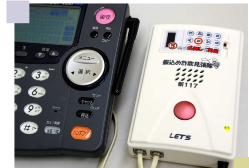
特殊詐欺防止に効果が高い 自動通話録音機（県警配布）