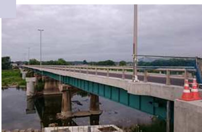
開通直前の九年橋 左脇が歩道橋の橋脚