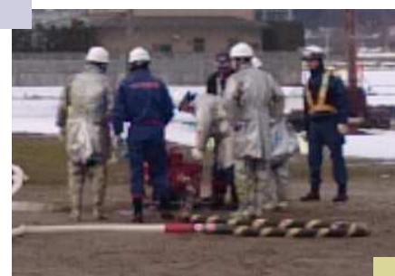
自主防災組織と消防署で 実施した防災訓練