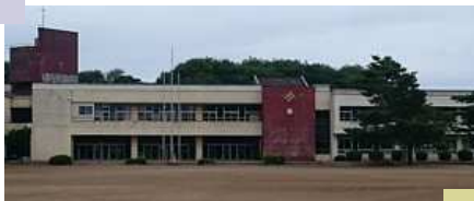
外壁の痛みも激しい南小

従って、今年度中に設計し、 平成28年度から30年度にかけての工事 となりそうです。その為、来年の国体時には、足場を組んだ状態かもしれません。