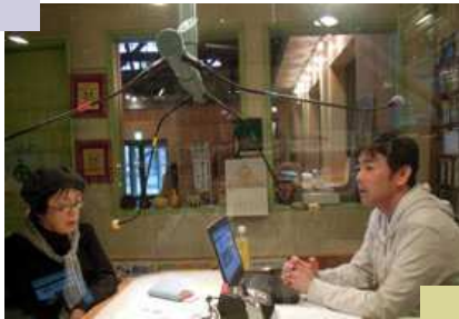
コミュニティFMのスタジオ (他局の事例)

本会議では「他の手段も調査する」、「調査結果を元に市民会議などを開催する」という答弁をしていましたが、当初から“ありき”で進めていた感は拭えず、 事業費を皆減する修正案が可決 されました。そこで、1頁にも書いたように、 議会では代替案を提言 として、まとめている最中です。