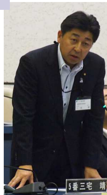
代表質問への 関連質問の様子

【答弁】6次産業支援補助金は、平成25年度に3件、平成26年度に2件の利用。商品によっては製造時期が限られ、通年販売につながらない。販売量が少なく、通年雇用の創出までには至らない、などの課題がある。