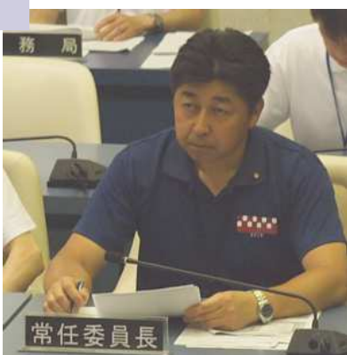
常任委員長答弁席で委員長報告 に対する質疑を聞いている様子