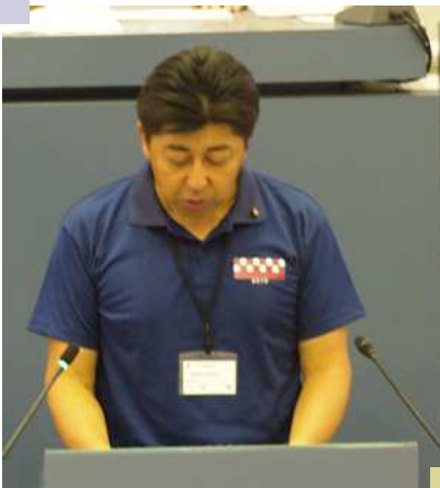
総務常任委員長報告 [全員が国体ポロシャツ を着て国体のPR]

北上市議会として、おそらく初めてとなる「議会からの政策提言」をなんとか9月の定例会前には実現できるように頑張っていきたいと思います。