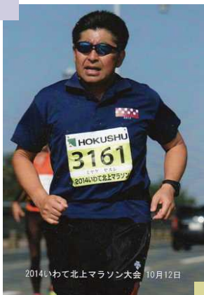
フルマラソン 2度目も完走