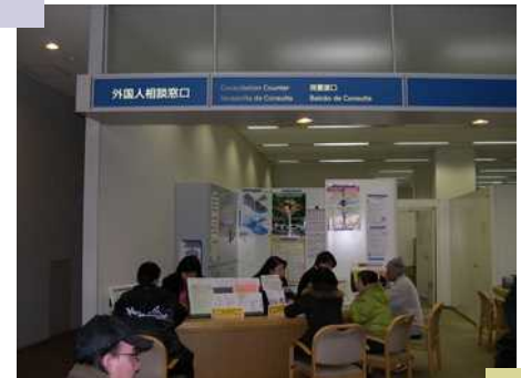
群馬県太田市の外国人相談窓口 (太田市は人口22万人のうち 8千人が外国人)

スマホ乗っ取り=無料のWiFiアクセスポイントを偽装し、アクセスしたきたスマートフォンに「遠隔操作アプリ」をインストールし、所有者に全く気が付かれず、全ての操作を行えるようにするハッキング手法。電話帳や通話履歴の抜き取りや、盗聴盗撮までできる。