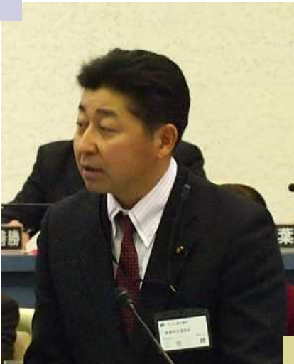
12月議会での一般質問