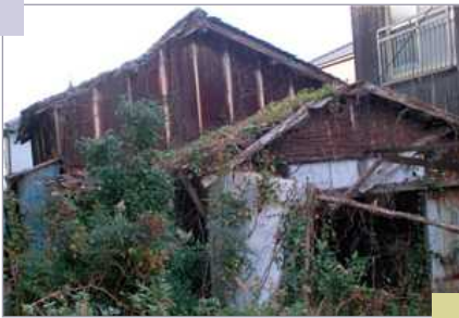
崩れそうな空き家 (他市の事例)

空き家等対策の推進に関する特別措置法 =市町村の権限強化が柱。放置すれば倒壊の恐れのある空き家や衛生上、著しく有害となる空き家などを「特定空き家等」と位置付け、市町村はそれらの所有者に対して、撤去や修繕を命令できるようになる。また、危険な状態の空き家の所有者を迅速に特定できるよう、固定資産税の課税情報の利用が許可された。空き家への立入調査もできる。