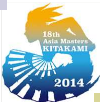
鬼剣舞を素材とした アジアマスターズ陸上のロゴ