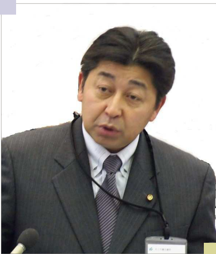
12月定例会一般質問の様子

最後になりましたが、皆様の益々のご支援、ご鞭撻をお願いし、年頭のご挨拶とさせていただきます。