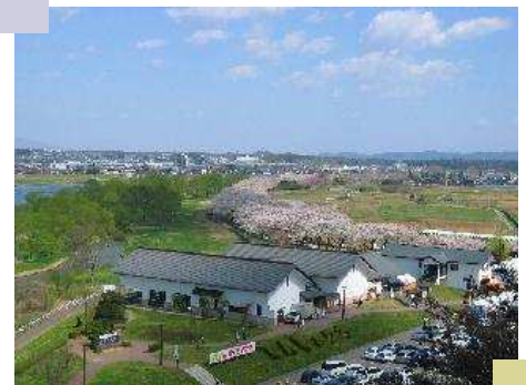
平成33年に開園100周年を迎える展勝地

* 輪中堤(わじゅうてい) = 直線的な堤防ではなく、一定の地域を取り囲むような形状の堤防。展勝地の堤防も市民プール付近の住宅地周辺に作られる。