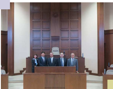
所属会派「北新ネット」の 逗子市議会視察・議場にて