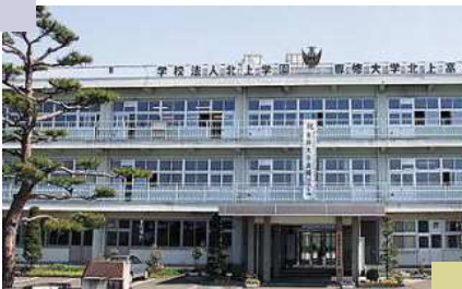
北上市内唯一の私立高校

神奈川県逗子市議会では、クラウド（“雲”の意味で、データやアプリケーションの保存場所を意識する事なく利用できるシステム）サーバーを利用して議案や決算書などを閲覧できるようにし、タブレット端末を導入してペーパーレスで議会を進めており、視察した結果をもとに一般質問を実施しましたが、当市においては時期尚早のようでした。