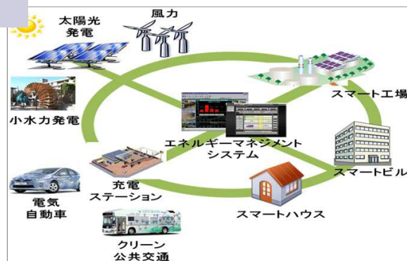
スマートコミュニティ イメージ図