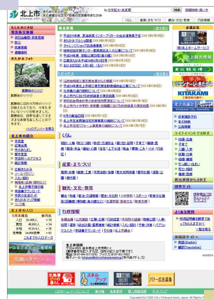
北上市HPのトップページ