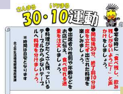
3010運動啓発ポスター例

答弁 ホテルや飲食店、北上工業クラブなどに呼び掛けたりして周知 を図り、各種宴会の冒頭で幹事からの呼びかけも見られるよう になったが、年末年始に向けて一層の周知を図りたい。