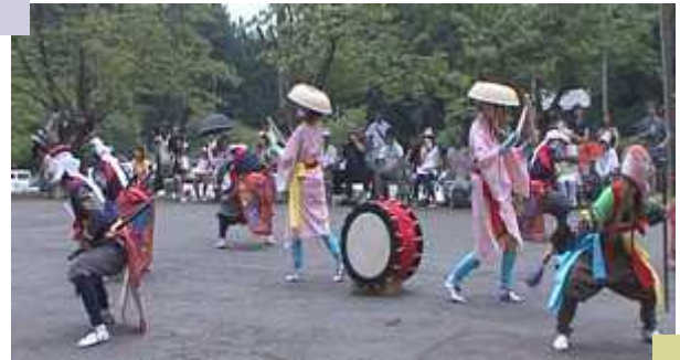
門岡念仏剣舞 （文部科学大臣表彰を受けた 照岡小PTAの地域との取組み）

答弁 「コミュニティ・スクール（学校運営協議会制度）」は2020年度の設置は努力義務で、2022年度には義務化される為、2019年度までに制度の趣旨や内容について研究し、学校や関係者に周知を図り、2020年度から2021年度は試行期間として2022年度の完全実施に向け準備を進めていく。今までと異なる点は、保護者や地域の代表が学校運営の支援に関わり、学校運営方針の承認や教員の任用にも意見を述べる事が出来る点である。これにより、地域も学校も子ども達もそれぞれ負担がおおきくなる可能性もあり、導入には十分な検討が必要である。