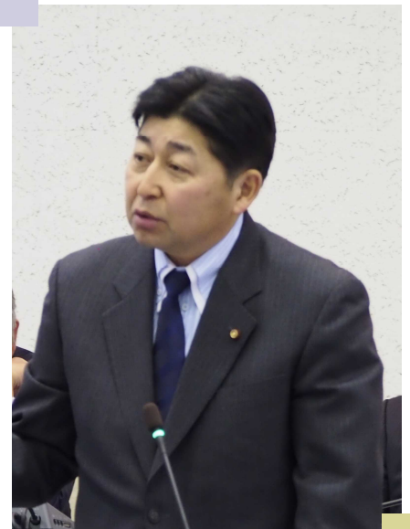
3月の代表質問での関連質問

答弁 市議会から3項目について提言があり、地域と話し合いを持つなど、参考にし策定した。プランは、北上済生会病院移転に合わせた路線バスの経路再編や、コミュニティバスの経路再編、稲瀬地区では既存の乗合タクシーを拠点間交通に活用した新路線の設置など、23事業を盛り込んだ。また、指摘の地区では、代替交通を計画したものの実施には至っておらず、新たに公共交通アドバイザー制度を活用するなどして再検討したい。