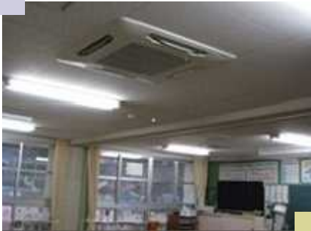
教室に設置されたエアコン (他市の事例)

(*)一般質問及び翌日の新聞では、県内の普通教室への設置率が1.1%と表現されましたが、これは平成26年調査の数値です。