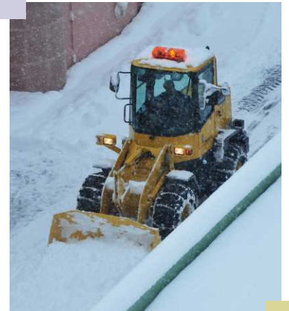
丁寧さと迅速さが望まれる 除雪作業

答弁 9月までに今年度の除排雪計画案をまとめ、16地区の説明会において意見交換を予定している。