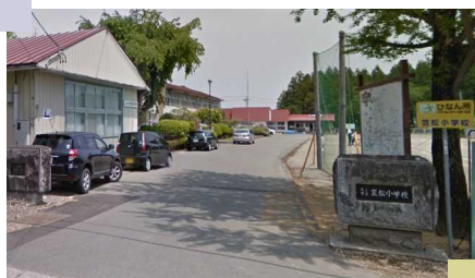
市内で唯一の木造校舎 笠松小学校